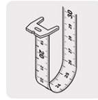
Cinta impresa por ambos lados