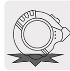
Resistente a impactos